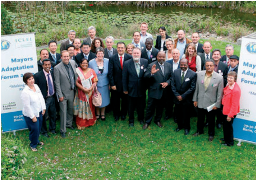
128 städer skrev på avtalet som ska lämnas över vid FN:s stora klimatkonferens

ETT NYHETSREVISOR OM KARLSTADS KOMMUNS INTERNATIONELLA ARBETE DECEMBER 2010