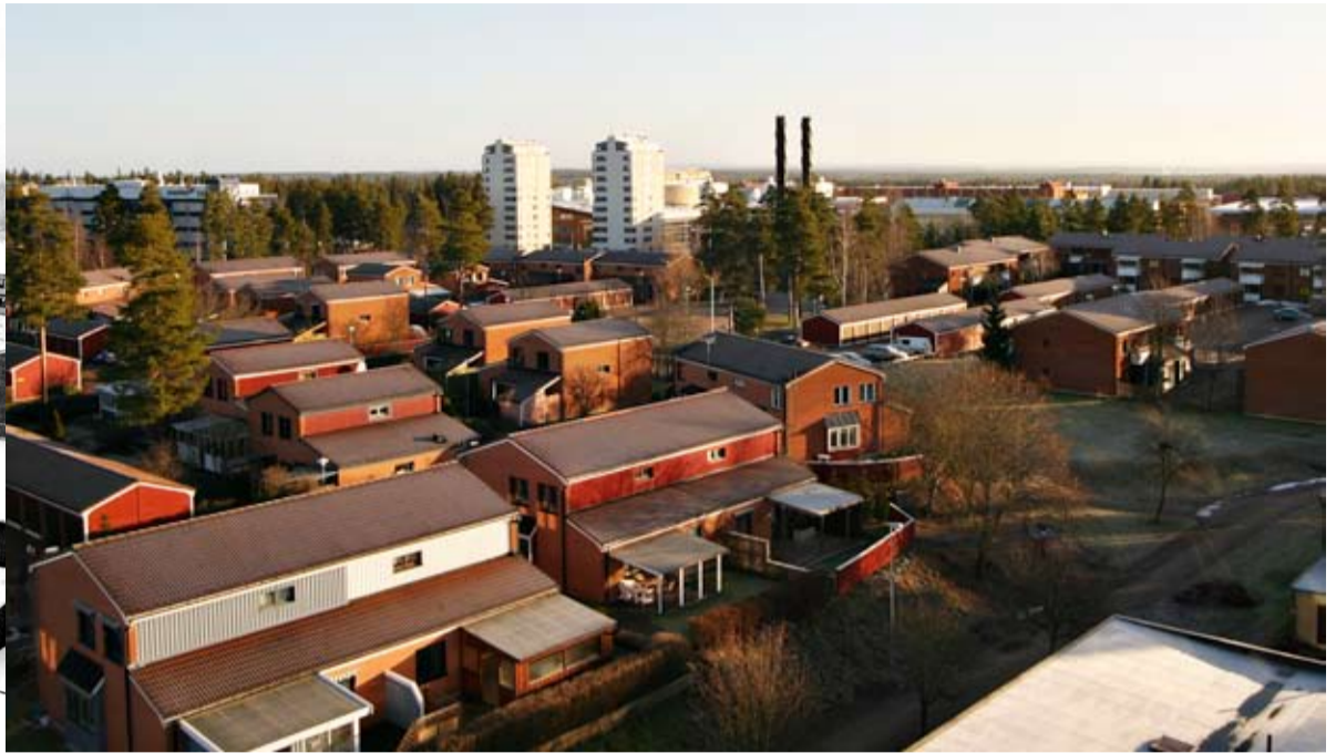
Universitetsområdet 2008. Universitetet är utvidgat med bland annat universitetsbibliotek, Studenternas hus och två tornliknande studentbostäder. Längst till höger skymtas nybygget, hus 21.