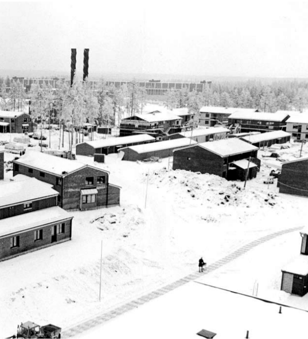
längst till vänster ryms idag Stora Ensos forsknings-