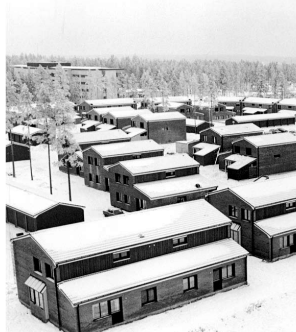
Universitetsområdet 1980. I dåvarande långvårdsjukhuset laboratorium.