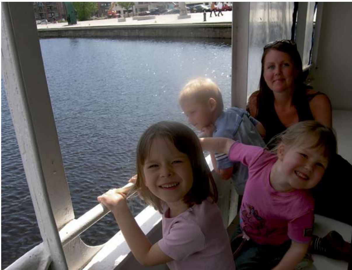
Dagisutflykt. Barnen och fröknarna på Gökboets dagis tycker att det är roligt att åka båt.