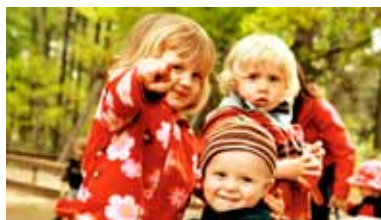
Väse. Nytt staket byggs för att skydda barnen vid den nybyggda lekparken.