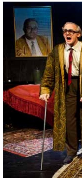
Ewig unga. Från vänster: Jonas S...

Spelas på Spinneriet till och med den 9 oktober. ■