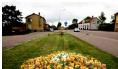
Skattkärr. Skattkärr blir lite grönare med nya urnor med blommor.