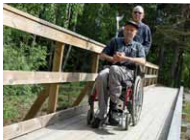
Rullvänligt. Ut till udden är det 700 m från parkeringen. På stigar och spångar ryms rullstol, rullator eller barnvagn.