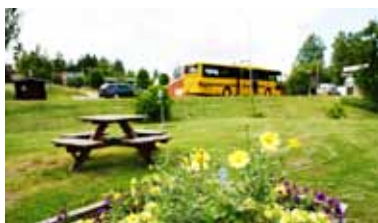
Edsvalla. Här blir det blomsterurnor och fler bänkar.