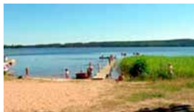
Molkom. Badplatsen ska göras i ordning och en grill kommer att ställas dit.