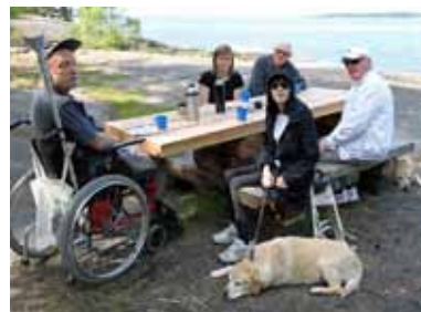
Gott om plats. Vid båda ändar vid fikabordet är det enkelt att komma intill med rullstolen.