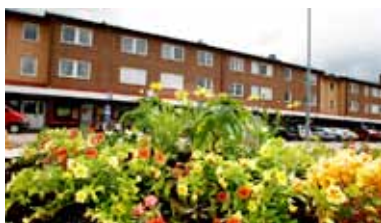
Vålberg. Här byggs nya sittplatser och asfalten byts ut mot stennjöl.

Text: Lena Gullander