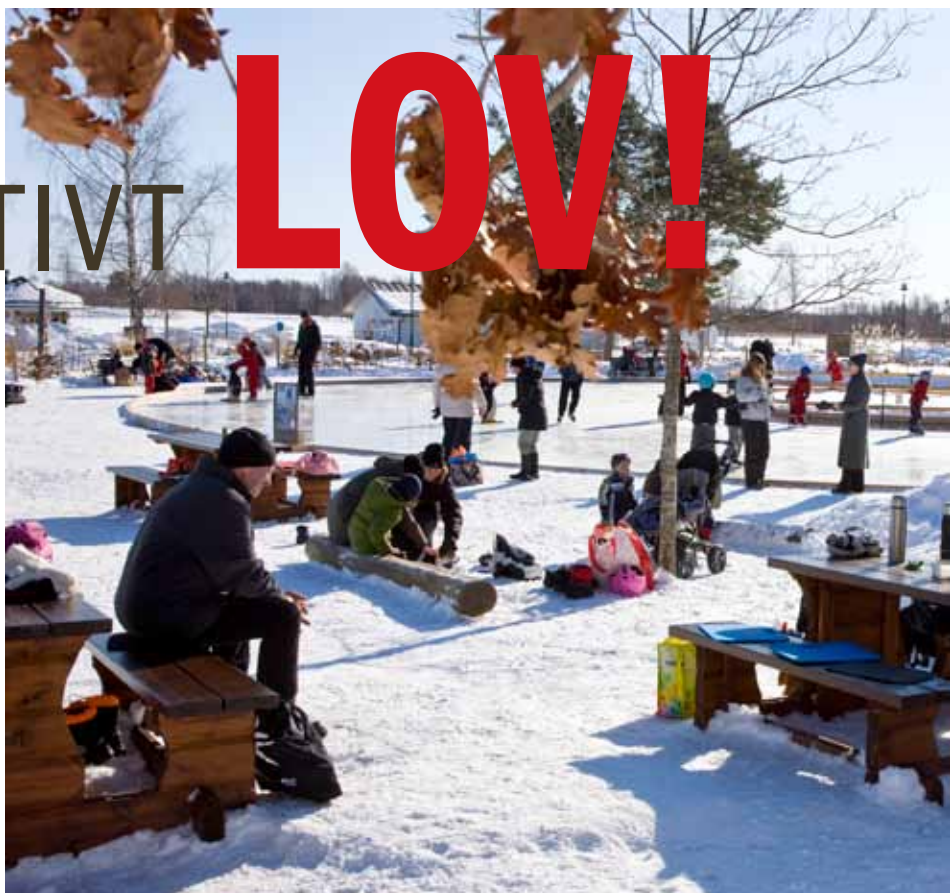
Lovaktiviteter. Mariebergsskogen erbjuder många aktiviteter under lovet, till exempel skridskoåkning och skattjakt.

Garanterat tomtefritt kommer det att bli på workshopen i skaparverkstaden på bottenvåningen i bibliotekshuset under mellandagarna.