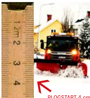
PLOGSTART 4 cm