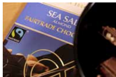
Fairtrade-märkt. Produkt som producerats under schyssta förhållanden.