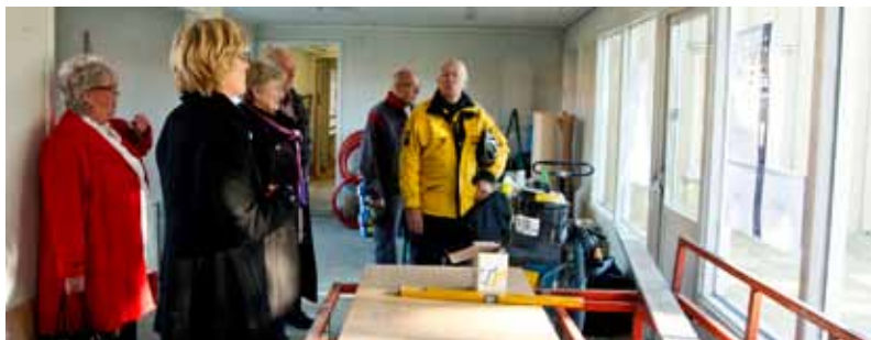
Solparadis. Utanför dörrarna finns det rejäla, nybyggda trädäck med söderläge och utsikt mot Klarälven. Där kommer det med stor säkerhet bli många sköna fikastunder.

► Alla, gamla som unga, vill vara behövda. På seniorernas hus kommer det att finnas stora möjligheter att engagera sig och bidra till verksamheten.