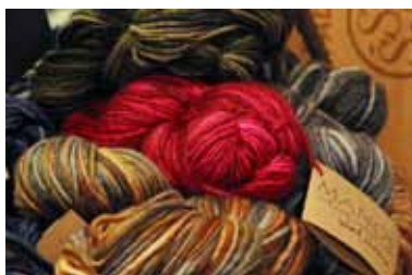
Stor potential. Textilier med Fairtrade-märkning är ganska svåra att hitta.