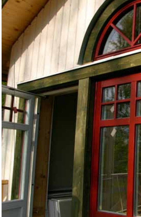
Fasadfärg. Att bestämma färg på huset tog rejält med tid.