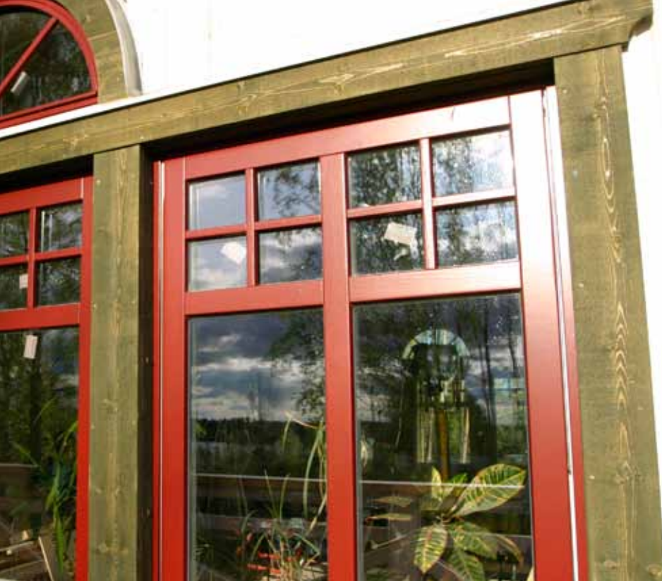
Till slut fastnade Kent och Jessica Evermark för antikvitt med oxfordrött och indiskt grönt kring fönstren.