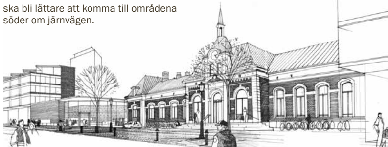
ILLUSTRATION: ARKITEKTEBYRÅN SWECO

Kommunstyrelsen har fattat beslut om att vara med och finansiera projektet Karlstads resecentrum med 40 miljoner kronor. I början av nästa år fattar regeringen beslut om projektet ska ingå i den nationella planen över infrastruktursatsningar. Planen pekar ut vilka satsningar som ska göras 2010–2021. Projektet kallas "Bättre kommunikationer och stadsutveckling – Karlstads centrum 2020".