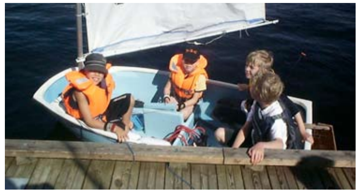
Aktivt. Gratis seglarskola är en av de aktiviteter som KBAB ordnar för sina hyresgäster i sommar.