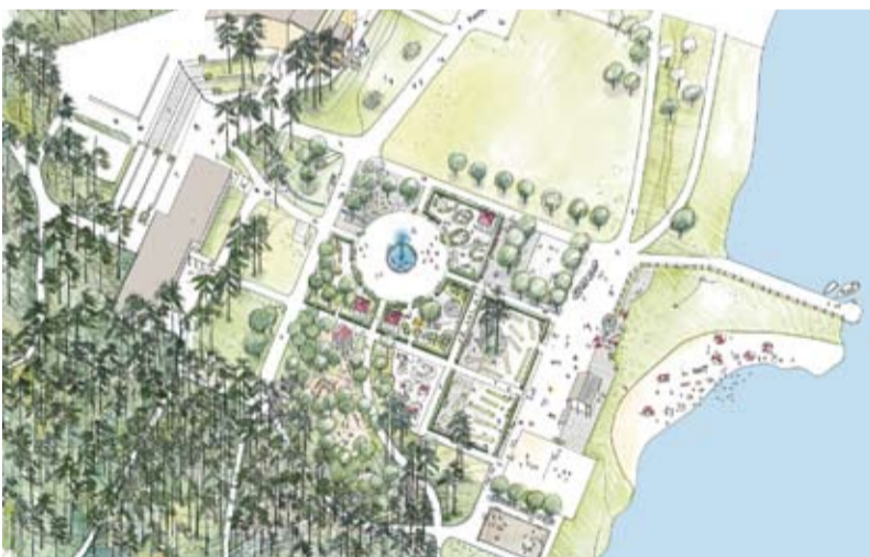
Mera lek. Fullt utbyggd kommer Lekträdgården att se ut så här. De delar som invigs till mid-sommar är de fyra avdelningarna kring fontänen. SKISS: ANNIKA WILÉN, WHITE ARKITEKTER

arna vidare till Naturum Värmland och kaféet. Allt vi gör i samband med Lekträdgården sitter ihop med vår ambition att få ihop hela Mariebergsskogen till en tydligare helhet, betonar Anna Löf Falkman.