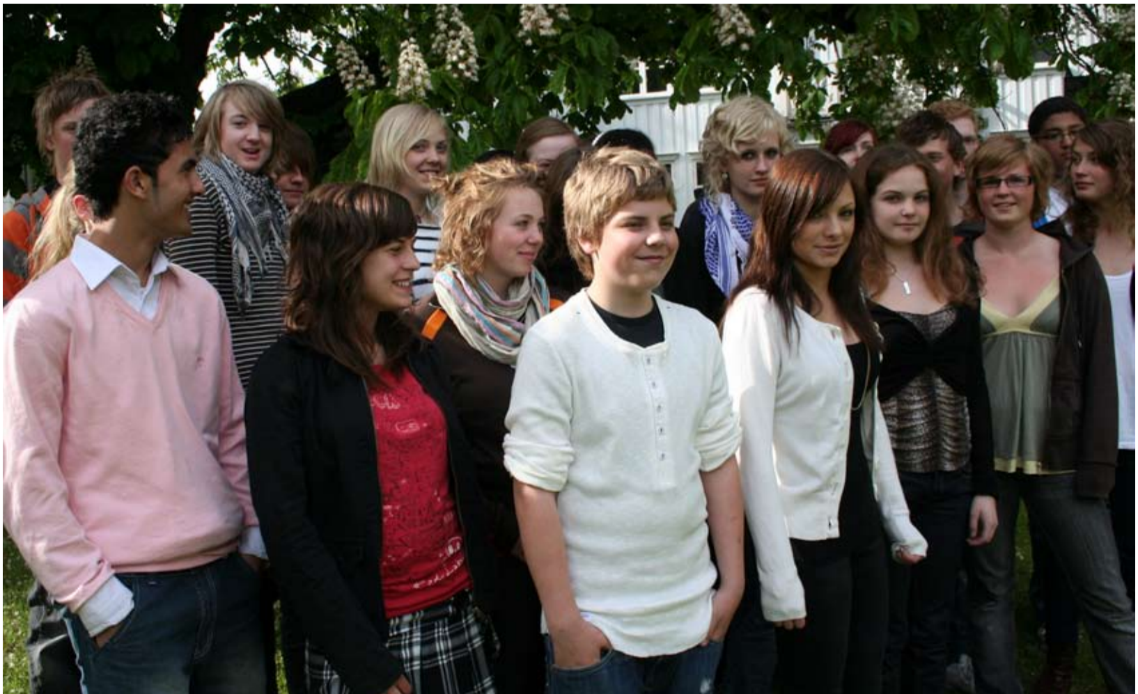
Unga politiker. Här ser ni delar av nya ungdomsfullmäktige. Vilka ungdomar som representerar ungdomsfullmäktige och vilken skola de går på kan du se på www.karlstad.se/ungdom/ledamoter2007_2008.shtml