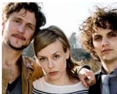
Moneybrother, Annika Norlin och Salem Al Fakir.