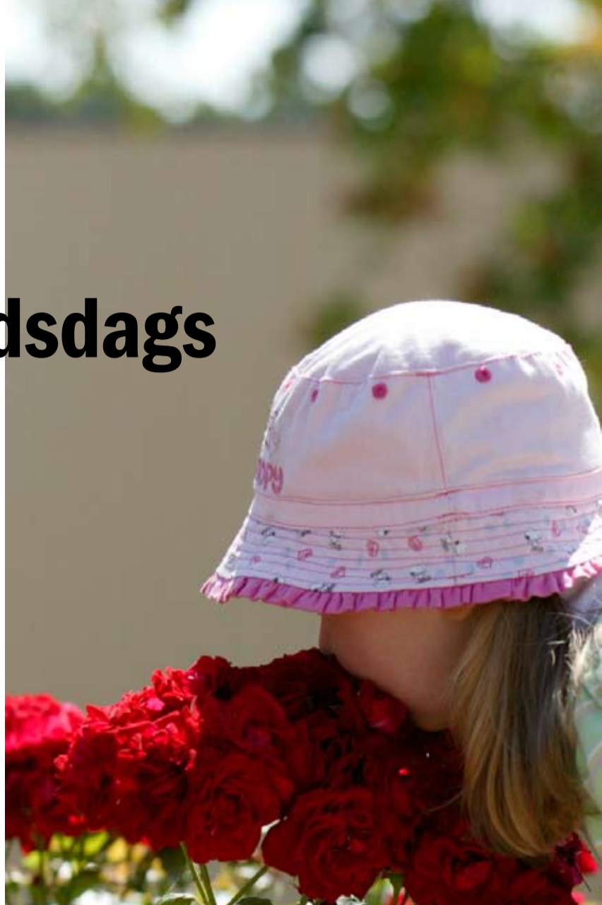
För alla sinnen. På i konstträdgården kan den som vill djupdyka i blommornas färgsprakande prakt.