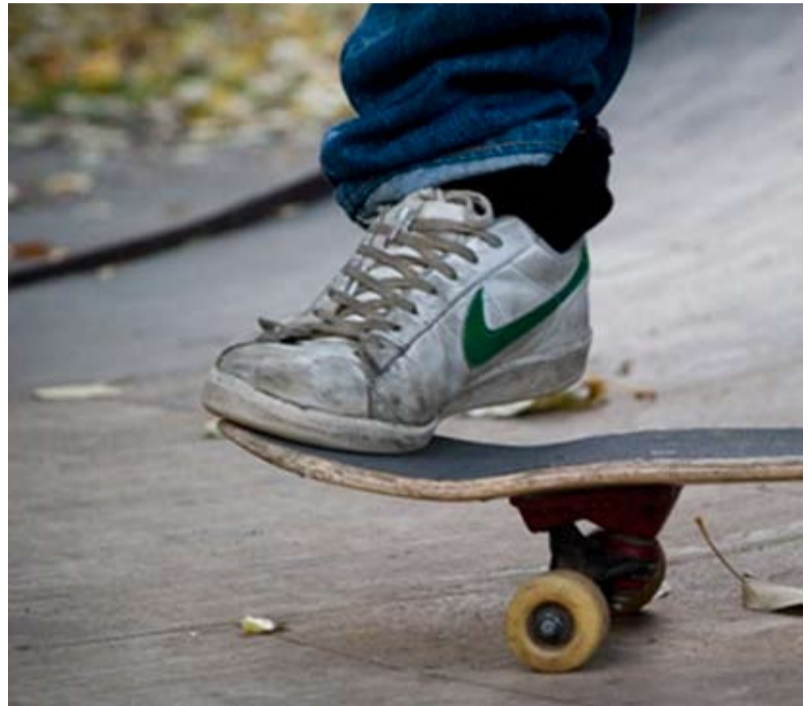
Snart inomhus. Hösten 2008 beräknas den nya curling- och skatehallen stå klar.

I dag har Karlstads Curlingklubb sin verksamhet i curlinghallen vid Löfbergs Lila Arena. Färjestads BK som äger fastigheten vill utveckla lokalerna för annan användning och har därför sagt upp kontraktet med klubben. Nu